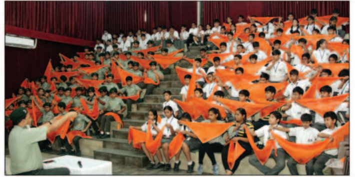
जयपुर के एसएमएस ऑडिटोरियम में आयोजित एक शिविर के दौरान स्काउट गाइड के बालक प्रशिक्षण प्राप्त करते हुए