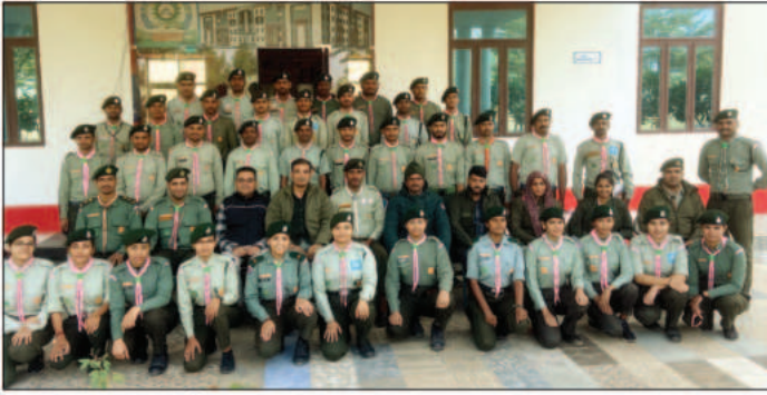
लीडरशिप ट्रेनिंग कोर्स के दौरान राज्य पदाधिकारी और स्काउट गाइड