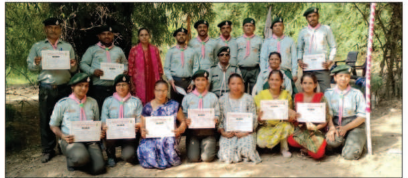
संभाग स्तरीय स्काउटर गाइडर बेसिक एडवांस्ड प्रशिक्षण शिविर उदयपुर