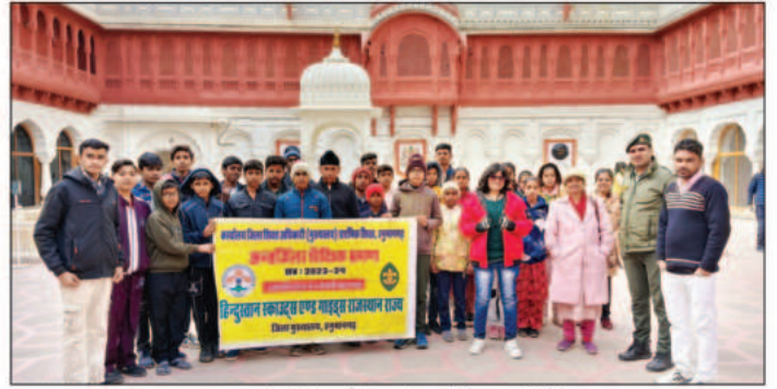
हनुमानगढ़- पांच दिवसीय अंतर जिला शैक्षिक भ्रमण के तहत बीकानेर किले में भ्रमण करते बच्चे