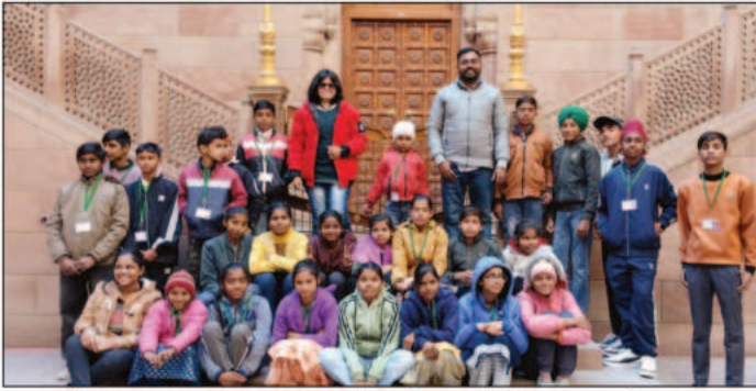
श्रीगंगानगर- पांच दिवसीय अंतर जिला शैक्षिक भ्रमण के तहत बीकानेर किले में भ्रमण करते बच्चे